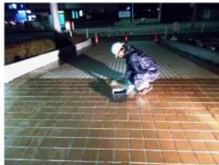
ちょっとしたタイルスロープ