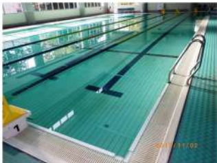
水濡れたプールの廻り